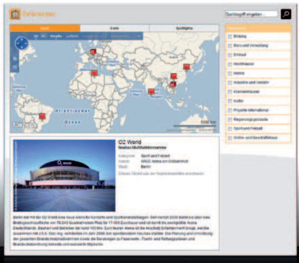
Hier finden Sie ausgewählte Projekte von hhpberlin - interaktiv und übersichtlich

Riskieren Sie einen Blick und machen Sie sich auf etwas gefasst: Seit dem 10. Mai 2010 haben wir von hhpberlin eine neue Website. Und wir sind ganz sicher: Das wird Sie begeistern, überraschen und positiv verwirren. Denn ein klassisches Menü, das Sie durch die Website führt, ist für uns Schnee von gestern.