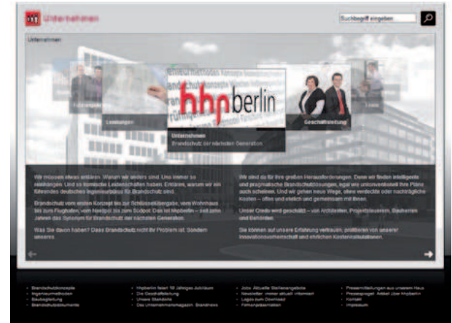
Lernen Sie hhpberlin kennen - unsere Mitarbeiter, unsere Standorte und unsere Visionen