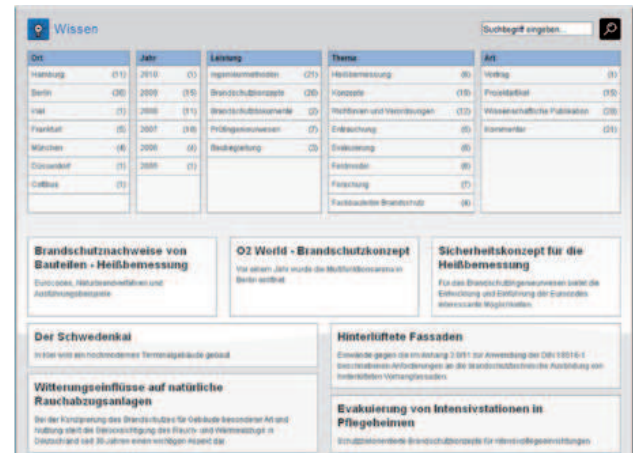
In unserer neuen Wissenswelt finden Sie künftig all unsere Artikel und Fachbeiträge u. a. nach Themen und Leistungen gegliedert. Stöbern Sie ein wenig - Sie werden sicherlich fündig.